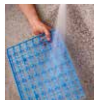
Fácil limpieza con agua a presión o lavavajillas.

Además, puede personalizar su estantería combinando distintos fondos, alturas y longitudes, con estantes lisos, barras colgadoras, etc. Consúltenos