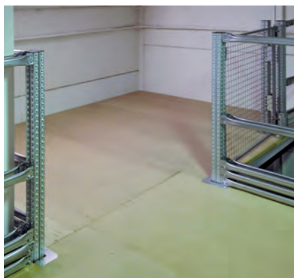
Suelo de tableros DM machiembrados.