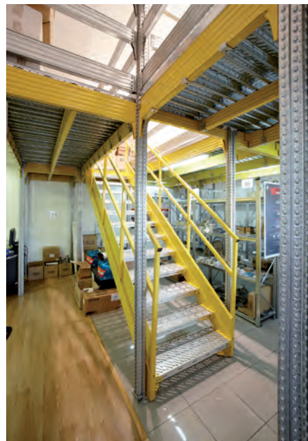
Parte inferior de la entreplanta.