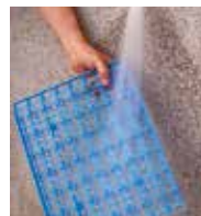
Fácil limpieza con agua a presión o lavavajillas.

Además, puede personalizar su estantería combinando distintos fondos, alturas y longitudes, con estantes lisos, barras colgadoras, etc. Consúltenos