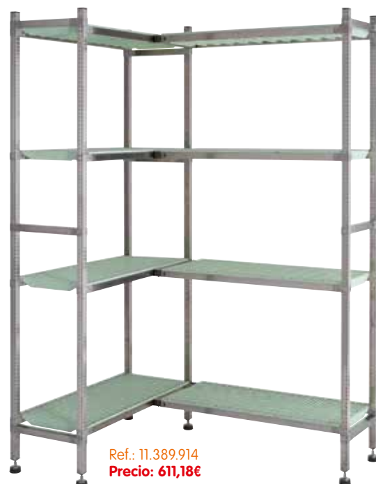
Ref.: 11.389.914 Precio: 611,18€

Compuesto por 1 módulo de 1.200 x 400 x 2.000 mm y otro de 900 x 400 x 2.000 mm (long. x fondo x alt.). Cada módulo tiene 4 estantes de polipropileno.