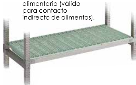
Estante con panel polipropileno de uso alimentario (válido para contacto indirecto de alimentos).