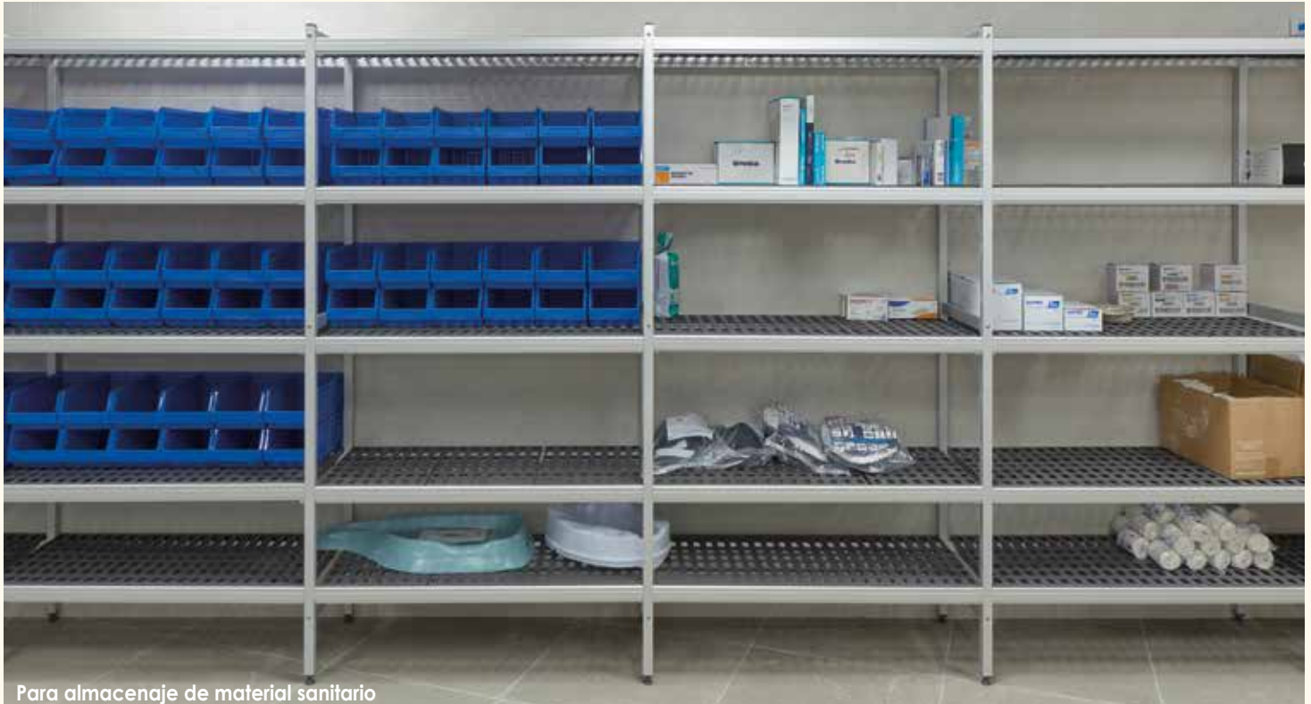
Para almacenaje de material sanitario

Sus posibilidades de ampliación vienen dadas por un sistema modular flexible y robusto, con múltiples accesorios y opciones de crecimiento, que ayuda a crear grandes instalaciones a medida.