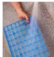
Fácil limpieza con agua a presión o lavavajillas.

Además, puede personalizar su estantería combinando distintos fondos, alturas y longitudes, con estantes lisos, barras colgadoras, etc. Consúltenos