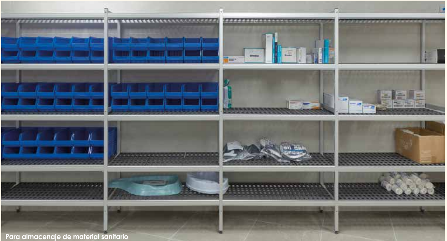
Para almacenaje de material sanitario

Sus posibilidades de ampliación vienen dadas por un sistema modular flexible y robusto, con múltiples accesorios y opciones de crecimiento, que ayuda a crear grandes instalaciones a medida.