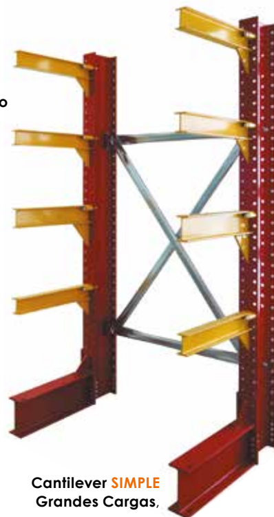
Cantilever SIMPLE Grandes Cargas,