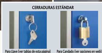
Para Llave (ver tablas de esta página)