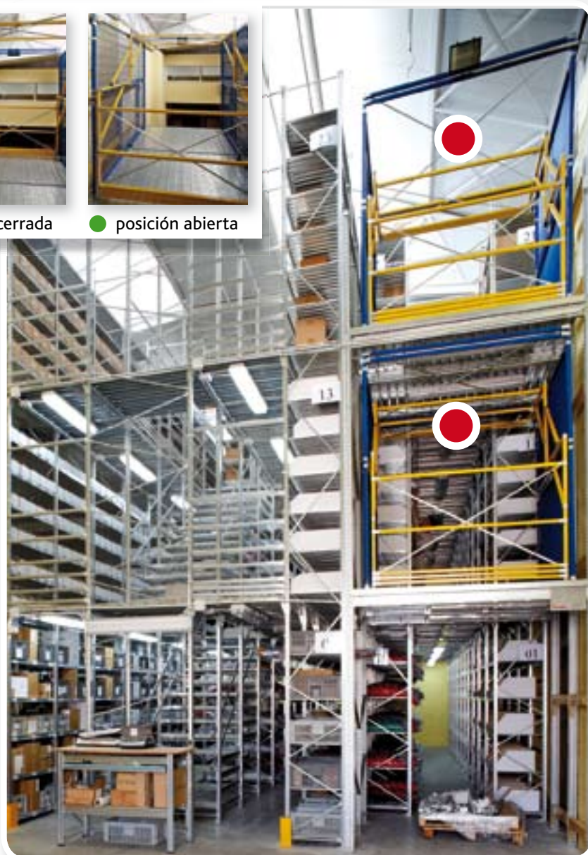
Instalación de suelo más dos niveles de pasillos elevados. Alt. mín. requerida 7.500 mm