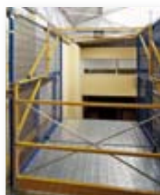
● posición abierta