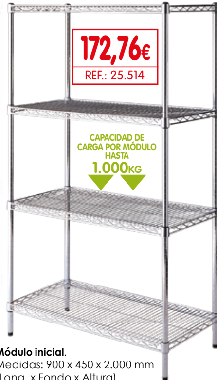
Módulo inicial. Medidas: 900 x 450 x 2.000 mm (Long. x Fondo x Altura). Ref.: 25.514 Precio: 172,76€