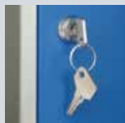
Para Llave (ver tablas de esta página)