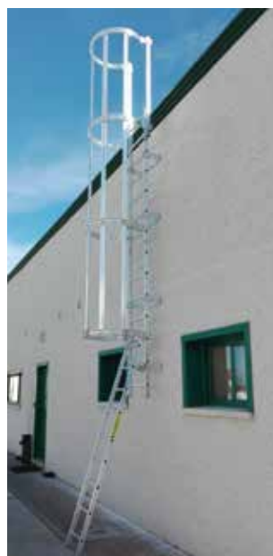
Tramo inferior móvil con trampilla anti-acceso