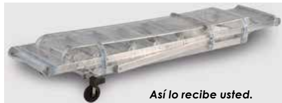
Así lo recibe usted.