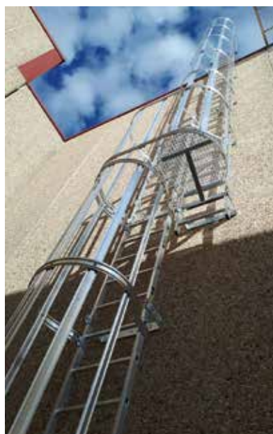
Acceso vertical en uso exterior, en tramos con descansillo intermedio para grandes alturas