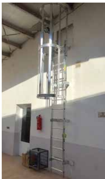
Acceso vertical en uso interior

Se fabrica para cualquier altura. Consúltenos.