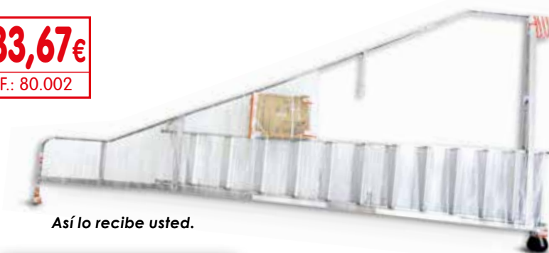
Así lo recibe usted.