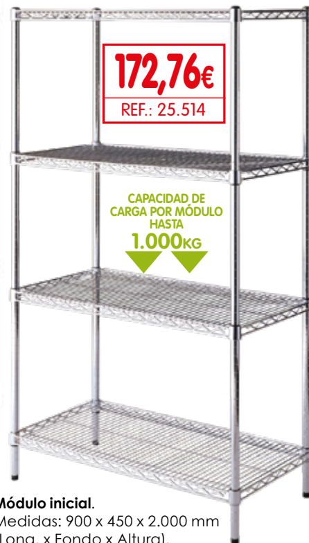
Módulo inicial. Medidas: 900 x 450 x 2.000 mm (Long. x Fondo x Altura). Ref.: 25.514 Precio: 172,76€