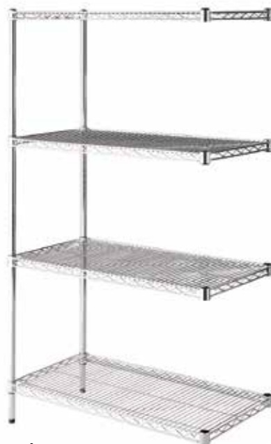
Módulo adicional. Medidas: 900 x 450 x 2.000 mm (Long. x Fondo x Altura). Ref.: 25.544 Precio: 149,50€