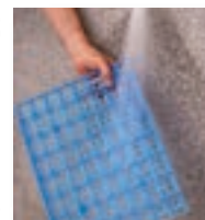
Fácil limpieza con agua a presión o lavavajillas.

Además, puede personalizar su estantería combinando distintos fondos, alturas y longitudes, con estantes lisos, barras colgadoras, etc. Consúltenos