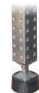
Base Plástica. (Estándar)

Cumple con las regulaciones actuales europeas para el contacto indirecto de alimento.