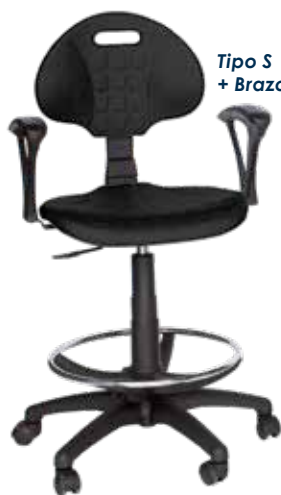
Tipo S + Brazos