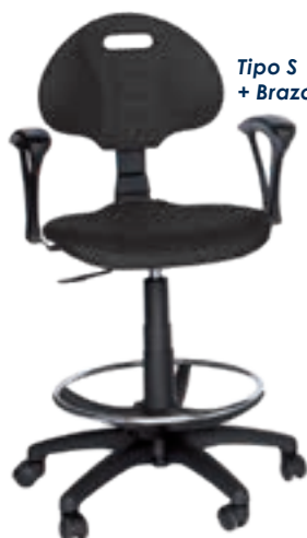
Tipo S + Brazos