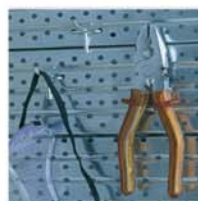
Ganchos tipo blíster (lote 10) ref. 13.501