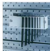
Soporte para 12 Llaves Allen ref. 13.032T