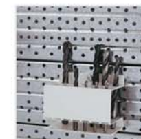
Soporte para 18 Brocas ref. 13.200T