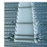
Soporte para 13 Llaves Planas ref. 13.033T