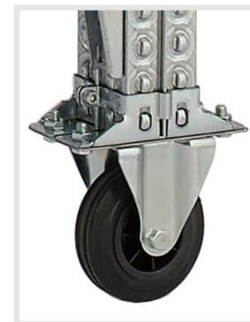
Ruedas orientables con freno