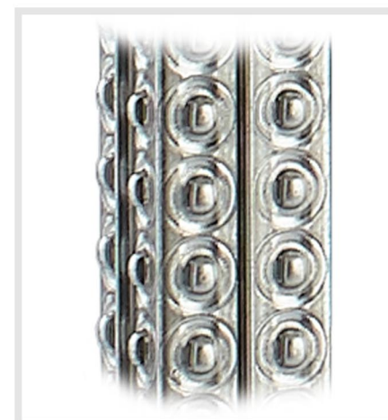
Sección cuadrada cerrada de 76 x 76 mm