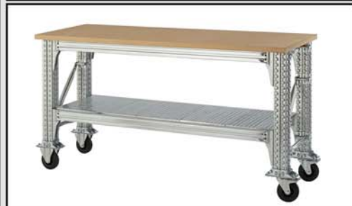
Bancos de embalaje y Mesas de trabajo