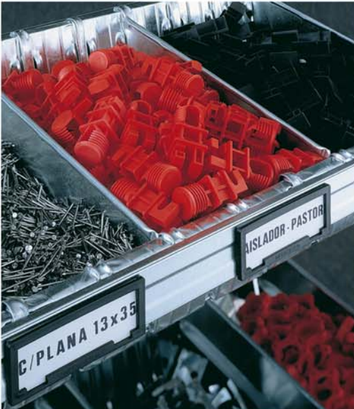
Estantes con cestos ideal para piezas pequeñas.