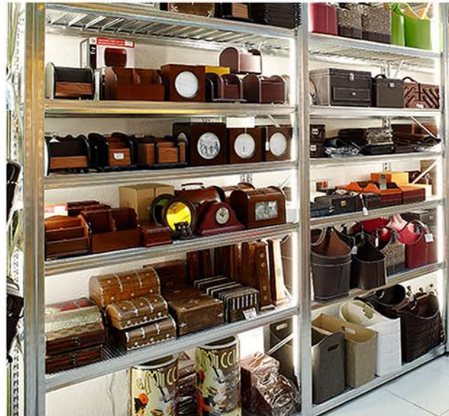
Añada luces para destacar más el producto.