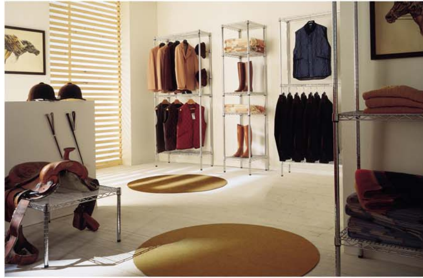
Estanterías de varilla cromada también con multitud de accesorios para máxima versatilidad.