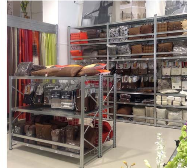
Estanterías de distintas alturas para colocar como isletas o en hileras ancladas a la pared. Fácil adaptación a su espacio.