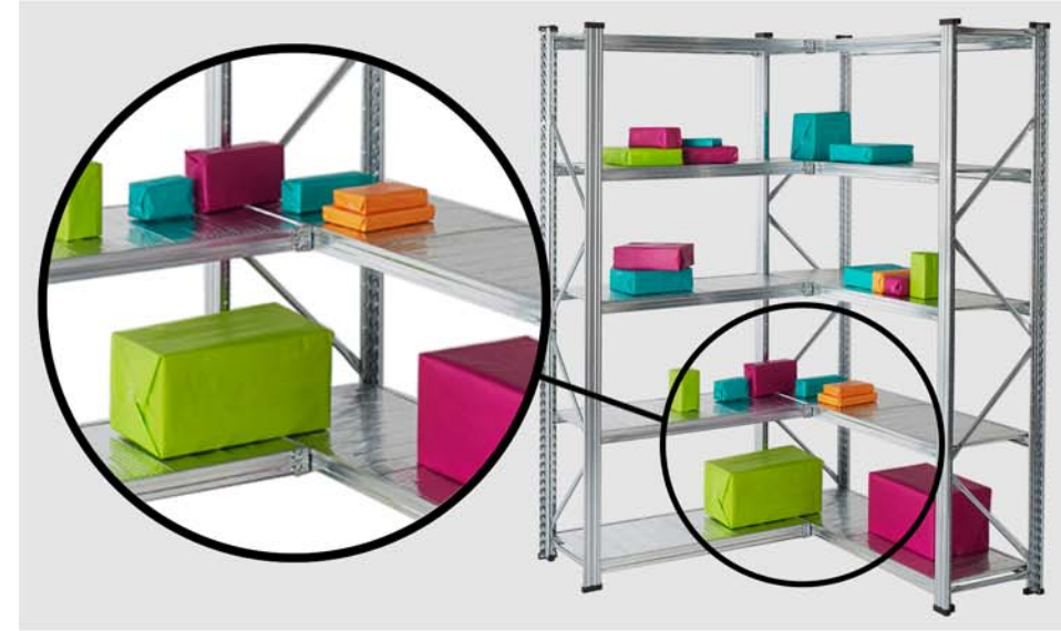
Estanterías en esquina , facilitan el acceso a la mercancía.