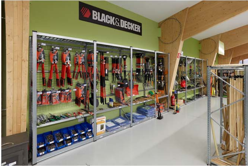
Multitud de accesorios disponibles, como mallas y ganchos para mejor exposición de productos .