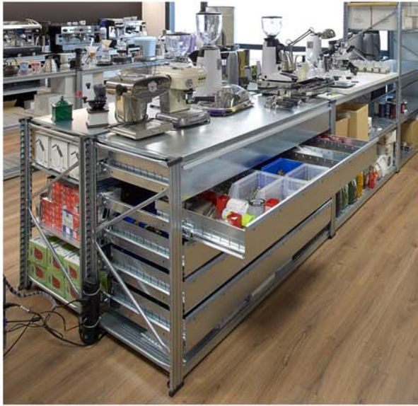
Los cajones extraíbles permiten guardar más material.