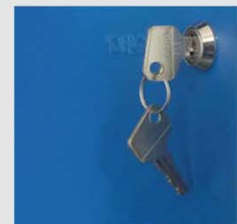
Cerradura de cilindro con 2 llaves