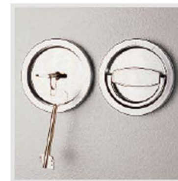
Cerradura de caja fuerte WITKOPP testada A2P grado A. Se suministra con 2 llaves.