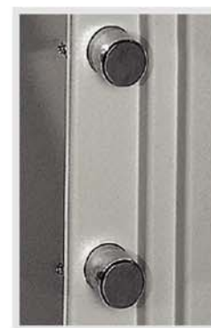
6 Bulones giratorios anti-sierra de \varnothing 25 mm