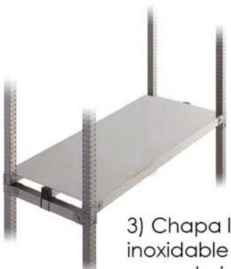
3) Chapa lisa de acero inoxidable sobre viga(s) secundaria(s) de acero inoxidable.