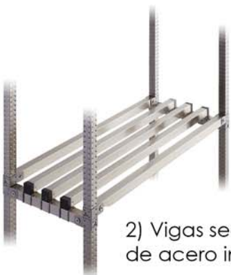
2) Vigas secundarias de acero inoxidable