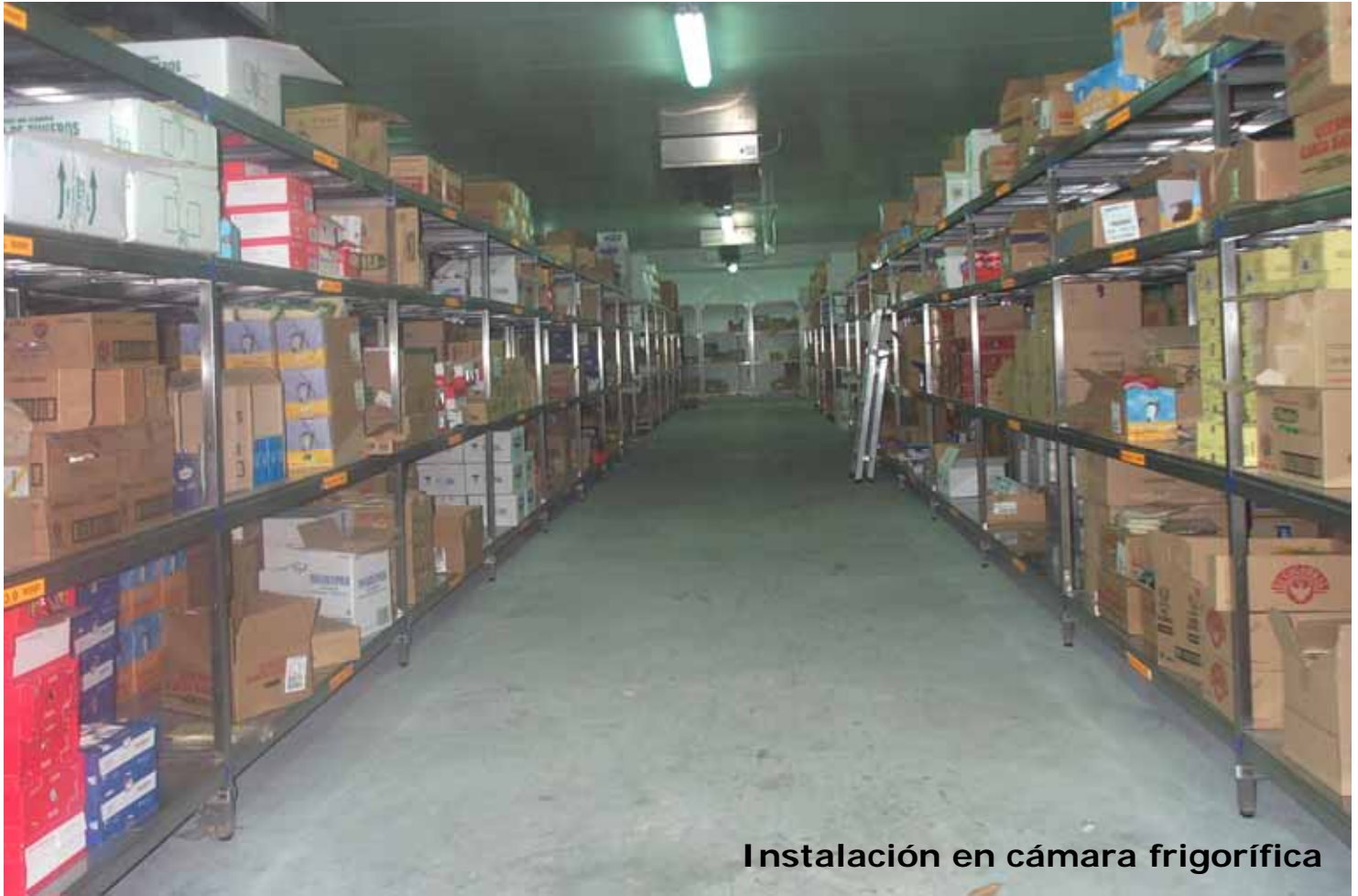
Instalación en cámara frigorífica