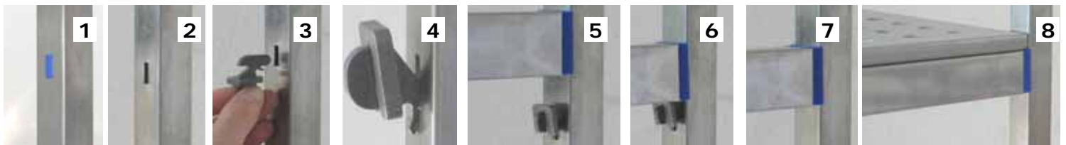
Sacar el protector e introducir la clavija