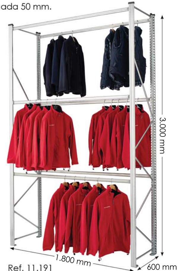
Ref. 11.191 Módulo inicial 3 niveles