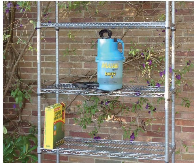
Estantes de varilla