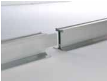
Empalme en rail guía