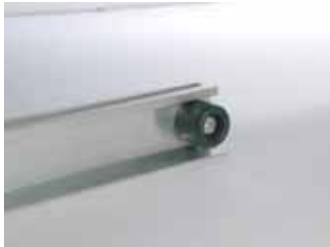
Tope extremo rail

Detalle de la sección del rail guía y la pieza móvil en posición