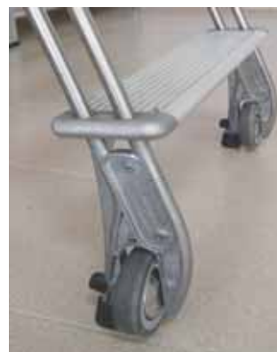
La escalera en posición vertical apoya sobre las ruedas. En posición inclinada apoya sobre lostacos plásticos