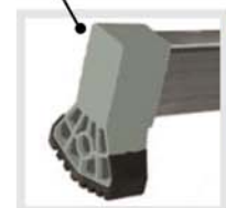
Barra estabilizadora con tacos antideslizantes extra-anchos